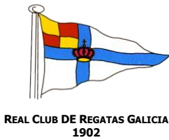
REAL CLUB DE REGATAS GALICIA 1902