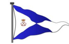
COMISIÓN NAVAL DE REGATAS