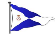
COMISIÓN NAVAL DE REGATAS

El hecho de que las balizas de salida, llegada ó recorrido no estén situadas exactamente en el lugar indicado, no podrá ser objeto de protesta. Igualmente, las longitudes de los recorridos.